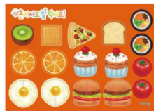
종이 음식 모형