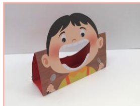
선대로 따라 접은 후 붙여 판을 세워요.