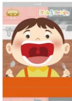
아이 얼굴 판

5월 셋째 주 추천 놀이입니다. 영상은 5월 21일부터 보실 수 있습니다.