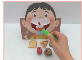
집게로 종이 음식 모형을 집어 아이 입속에 쏙 넣어요.