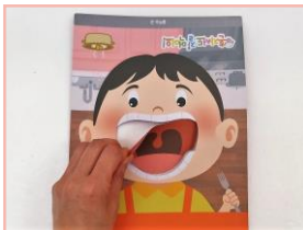
아이 얼굴 판의 입속 종이를 떼어 내요.